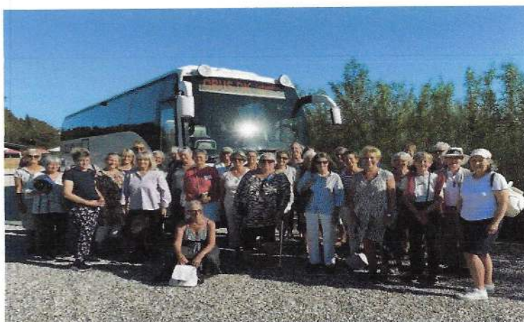
Udflugt med bus til Labyrinten i Gilleleje den 5.09.2023.

Dejlig fri for corona-begrænsninger har året givet os mange spændende møder og udflugter: